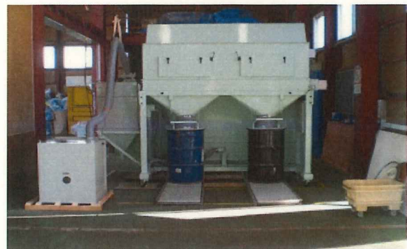
40wの蛍光灯 約600本封入